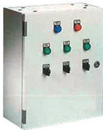
Tablero de fuerza y control (Referencial)