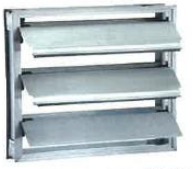
Dámper Barométrico (Referencia)